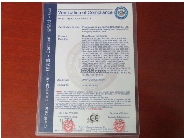
产品体系证书证明材料